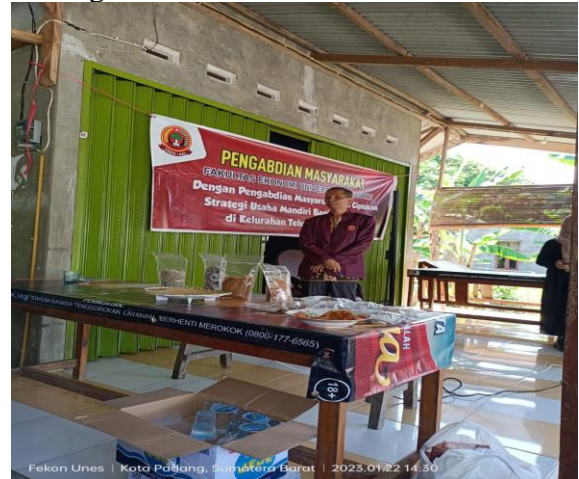
Gambar 3. Pemberian Materi Market Share Dengan Metode Ceramah Kepada Mitra Di Lokasi PKM

mengentaskan kemiskinan serta pemberdayaan UMKM dalam sektor kewirausahaan dan Pengembangan usaha mikro kecil menengah (UMKM) merupakan salah satu prioritas dalam pembangunan ekonomi di Kotamadya Padang.