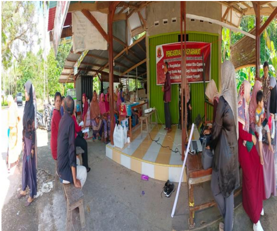
Gambar 2. Pemberian Materi Dengan Metode Ceramah Kepada Mitra Di Lokasi PKM

Di dalam pelaksanaan PKM ini dilakukan dengan metode ceramah guna memberikan wawasan dan pengetahuan tentang Teknik market share dengan pemanfaatan platform serta media sosial, adapun Tahap awal dari pelaksanaan kegiatan yaitu penjelasan materi tentang dasar-dasar Teknik market share, pengenalan platform, serta prosedur penggunaan platform, manajemen dan kewirausahaan. Materi disampaikan menggunakan metode ceramah yang diselingi dengan diskusi., peserta juga diberikan contoh dan praktek bagaimana cara Teknik market share dengan memanfaatkan platform dan media sosial dimulai dari dasar cara aplikasi tersebut. Untuk itu pada tahapan ini mitra hanya diminta untuk memperhatikan seperti contoh yang dilakukan oleh intruktur yang dapat dilihat pada Gambar 3.