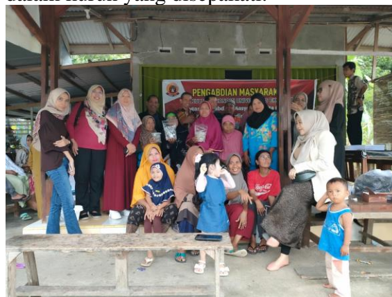
Gambar 1. Persiapan Pelaksanaan Kegiatan PKM di Kelurahan Teluk Kabung Tengah

Kegiatan ini diawali dengan kegiatan temu ramah serta dimulai dengan pembuatan MoU dilokasi pelaksanaan PKM dengan mitra serta unsur-unsur terkait, yang mana kegiatan ini bertempat dikawasan pemukiman warga kelurahan Teluk Kabung Tengah. Dalam pelaksanaannya kami dengan pihak mitra melakukan kesepakatan untuk dapat melakukan pembinaan serta pelatihan dalam kurun yang disepakati.