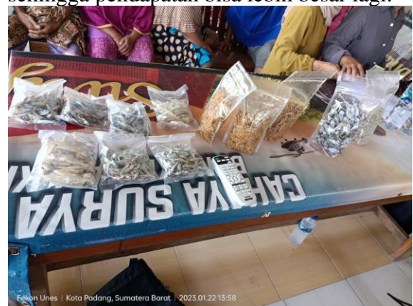
Gambar 4. Contoh Produk Hasil Olahan Ikan Mitra Dilokasi Pelaksanaan PKM

Berdasarkan hal tersebut, maka Tim Pengabdian Masyarakat dari Fakultas Ekonomi Universitas Ekasakti, melakukan pengabdian kepada pelaku UMKM di Teluk Kabung Tengah, khususnya UMKM yang melakukan pengolahan hasil laut seperti ikan. Pengabdian ini dilakukan dengan cara mengedukasi pemberian pengetahuan dan ketrampilan dalam usaha yang dilakukan. Diharapkan dengan adanya kegiatan ini UMKM bisa mengembangkan usahanya lebih baik lagi, sehingga pendapatan bisa lebih besar lagi.